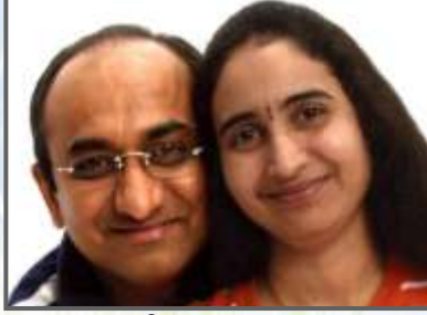
આશિષ - ભાવના

Best wishes and congratulations to Dad - Mom / Baa - Daadaa